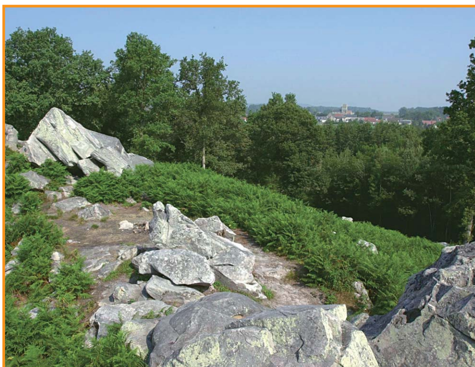
La hottée de Gargantua. -S. Lefebvre-

Cette fiche est extraite du site www.randonner.fr