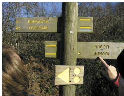
Une photo locale des sentiers ou balisage

Vous pourrez vous y procurer une fiche d'observation Ecoveille®.