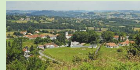
Village de Luxe

Cette petite randonnée fait le tour de la « Turun » de Luxe d'où l'on peut voir 12 clochers et un paysage aux couleurs du Pays Basque. Au loin se profile la chaîne des Pyrénées et le pic d'Orhi, le plus haut sommet du Pays Basque.