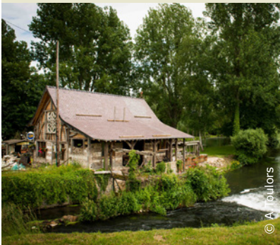
Un bain de nature au bord de la Somme

INFOS TOURISTIQUES : Office de Tourisme et des Congrès du Saint-Quentinois Tél. : 03 23 67 05 00