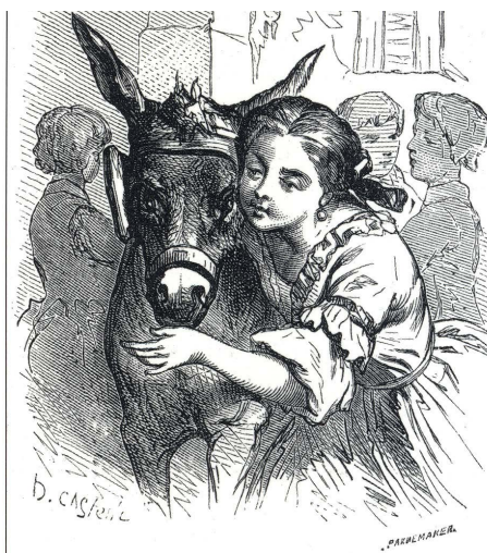
Comtesse de Ségur - illustration des Mémoires d'un Âne

Aube, à 8 km à l'ouest de l'Aigle par la D926