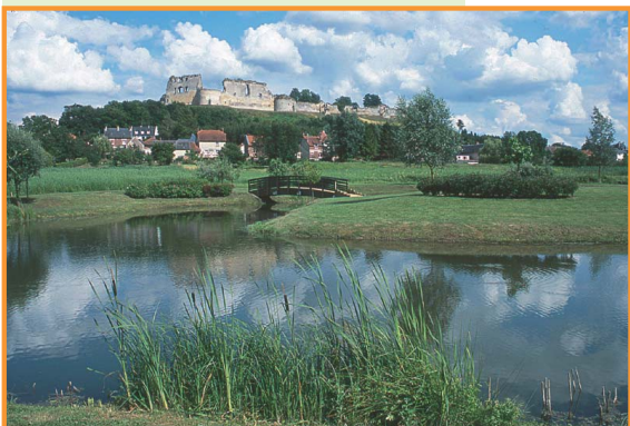
Le château de Coucy. -S. Lefebvre-